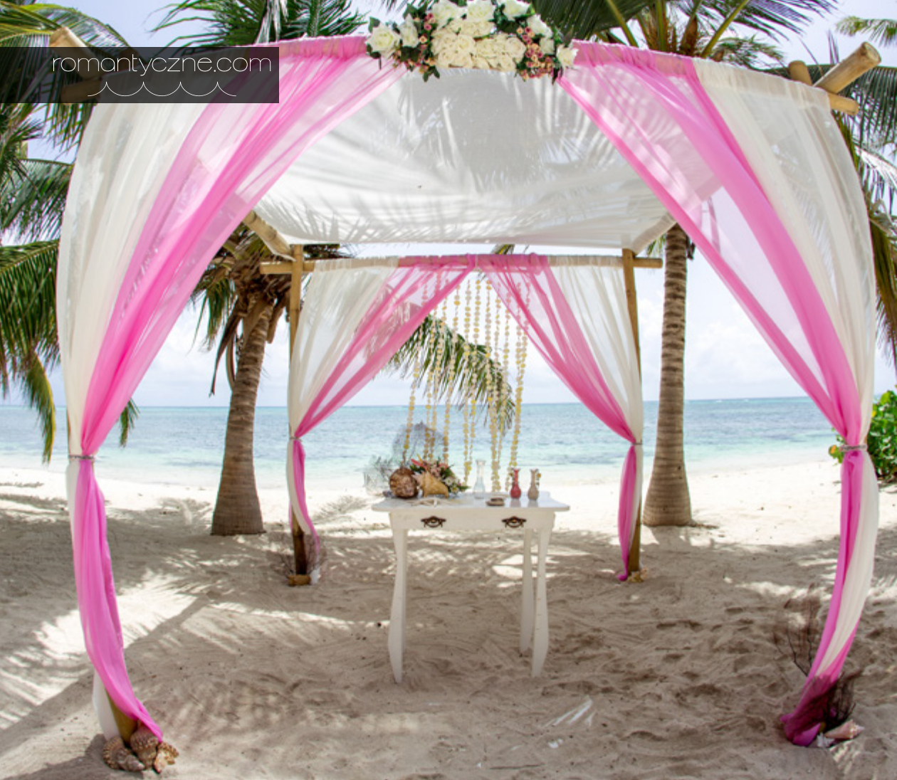
Bambusowe gazebo z delikatnymi akcentami różu...