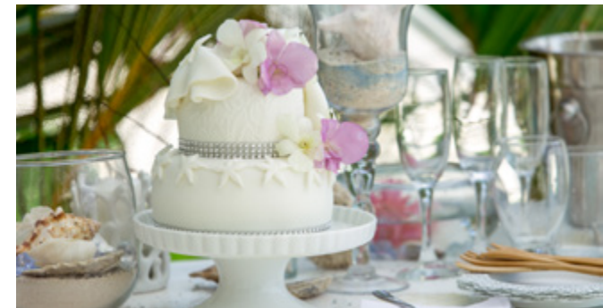
Storczyki dodadzą blasku Pani Młodej...