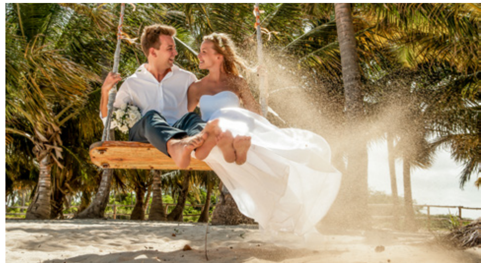
Wszystko możemy dla Ciebie przygotować...